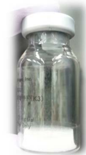
※写真は製品イメージです